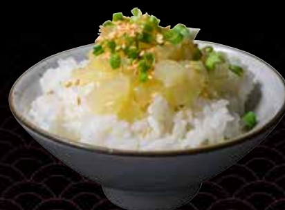
Negi Meshi Onion Rice Bowl