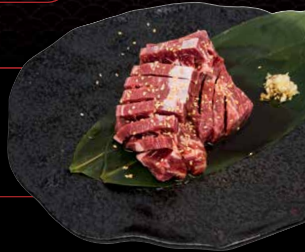
U.S. Prime Short Rib (200gm)

*Australian Marbling Score: from 9 (Premium Marbling) – 1 (Leanest)