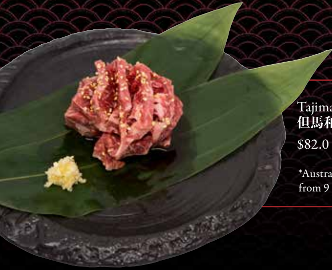
Tajima Wagyu Beef Striploin MS 8* (200gm) 但馬和牛サーロイン