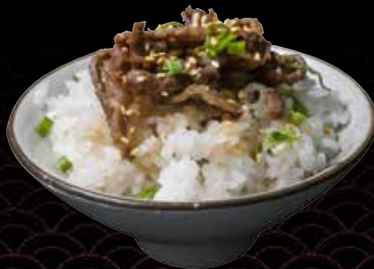
Mini Beef Shoyu Tare Rice Bowl