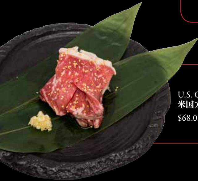
U.S. Grain-fed Angus Striploin (200gm)